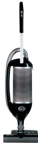
FELIX 1 PREMIUM PLATINUM Art.Nr. 90810SF