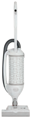
FELIX 1 WHITE Art.Nr. 90802SE