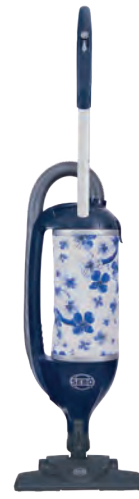
FELIX 4 KOMBI ORIENTAL Art.Nr. 90845SE