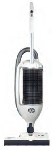
FELIX 2 PREMIUM PEARL Art.Nr. 90821SE