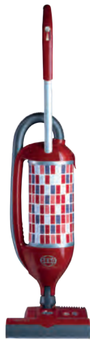
FELIX 1 PREMIUM ROSSO Art.Nr. 90813SF