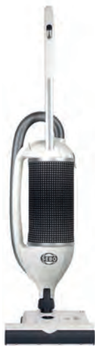
FELIX 1 PREMIUM PEARL Art.Nr. 90811SE