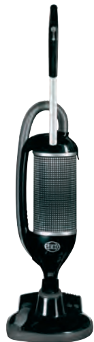
FELIX 3 PLATINUM Art.Nr. 9880SE